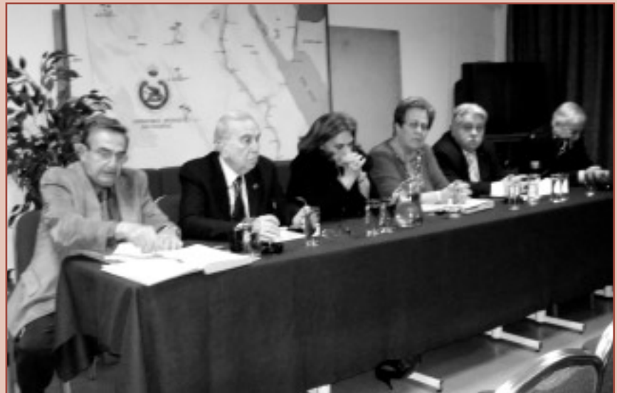
Από τη Γ. Συνέλευση και το Πάρτυ του ΣΑΑΣΑ