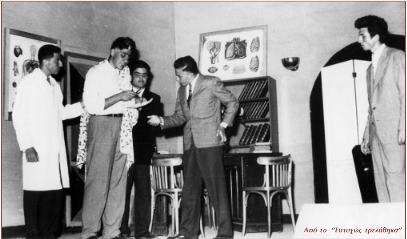
Από το "Ευτυχώς τρελάθηκα"

Όταν αυτός τούς λέει ότι προτιμά να αρχίσουν πρόβες σε κάποια πιο σοβαρή κωμωδία,, εκείνοι τού αντιτείνουν ότι έχουν ήδη έτοιμη και διασκευασμένη - για να αποφύγουν τους γυναικείους ρόλους - την επιτυχημένη κωμωδία του Δ.Ψαθά, έχοντας κάνει όλο το καλοκαίρι τις αναγκαίες πρόβες. Ο Χατζηανέστης τότε αναγκάστηκε να δεχθεί να παρακολουθήσει μια πρόβα, για να αποφασίσει για την τύχη αυτού του θεατρικού τολμήματος.