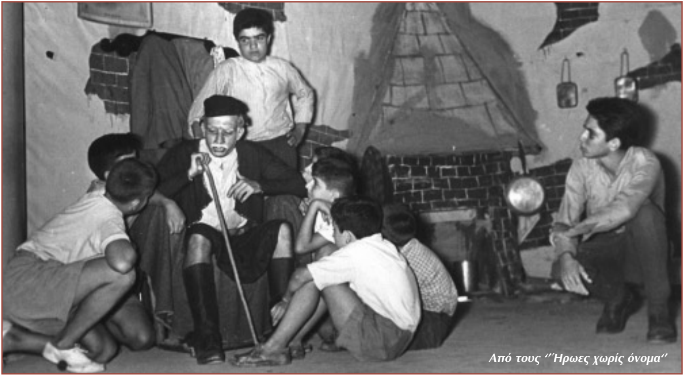
Από τους "Ηρωες χωρίς όνομα"

Φθινόπωρο του 1957. Οι Αγγλογάλλοι έχουν αποχωρήσει από τη διώρυγα, έχει αρχίσει η εκδίωξη κάποιων Ευρωπαίων από την Αίγυπτο, οι Έλληνες είναι οι μοναδικοί πιλότοι της διώρυγας του Σουέζ, το Rock and Roll συνεχίζει