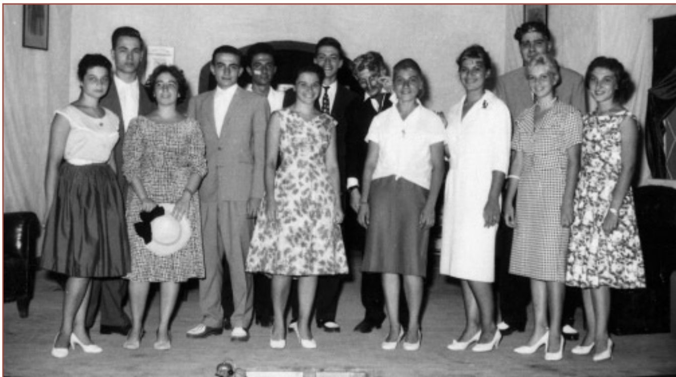
Ομάδα ηθοποιών του θιάσου " ΑΛΕΞΑΝΔΡΙΝΟΙ ΕΡΑΣΙΤΕΧΝΑΙ "