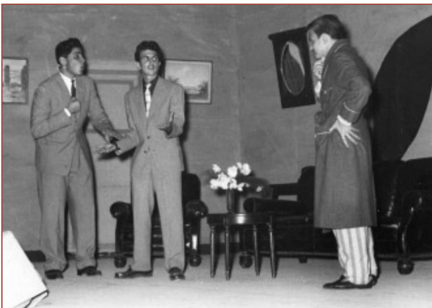
Από το "Ένας θλάκας και μισός"

μια ομάδα μαθητών της προτελευταίας τάξης παρουσιάζεται στο γυμνασιάρχη αρρένων Ερρίκο Χατζηανέστη και τολμά να ζητήσει να ανεβάσει στην αίθουσα Ιουλίας Σαλθάγου την κωμωδία του Ψαθά "Ένας θλάκας και μισός".