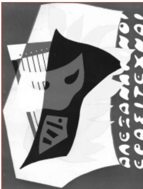
Πρόγραμμα του ερασιτεχνικού θιάσου