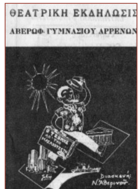
Το πρόγραμμα του "Τζώνυ από τη Μασαχουσέτη"